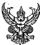
ขนาดตัวครุฑสูง ๓ เซนติเมตร